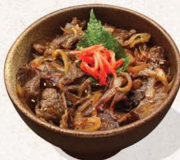
焼肉丼 Yakiniku Don