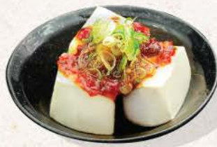
ピリ辛奴 Pirikara Yakko