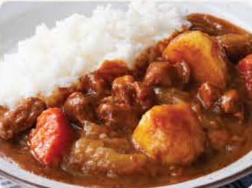
チキンカレー Chicken Curry