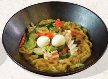
五目ラーメン Gomoku Ramen