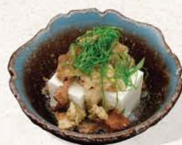
牛すじ豆腐 Gyūsuji Tōfu

slow-braised beef tendon simmered with tofu in a rich savory broth