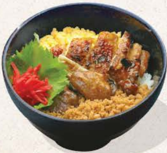
鶏照り焼き丼 Tori Teriyaki Don