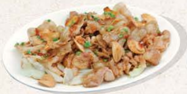
豚元気焼き Buta Genki Yaki