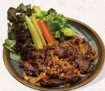
ビーフ焼肉 Beef Yakiniku

sauteed Australian beef with yakiniku sauce