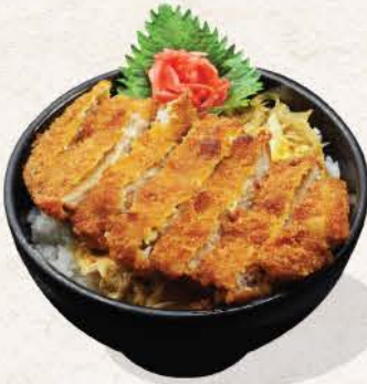
チキンカツ丼 Chicken Katsu Don

115 ++ deep fried chicken cutlets served with rice and Japanese curry