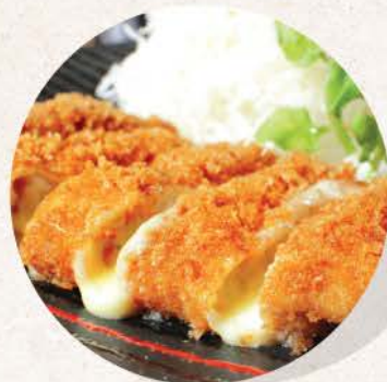
ミルカツチーズ Mirukatsu Cheese

deep fried pork sirloin cutlet with mozzarella cheese filling