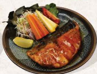
サーモン 照り焼き・塩焼き Salmon Teriyaki / Shioyaki

grilled salmon with teriyaki sauce or salt