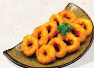
イカリリング Ika Ring