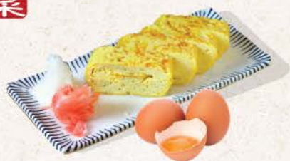
厚焼き玉子 Atsuyaki Tamago