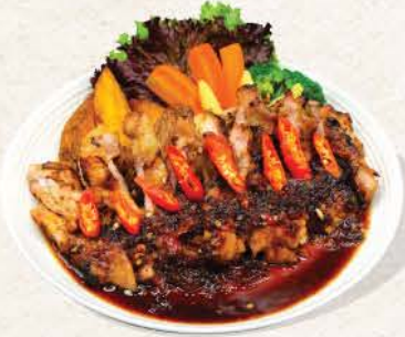
チキンハラペーニョ Chicken Jalapeno

100 ++ grilled marinated chicken with spicy Jalapeno and teriyaki sauce