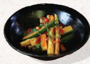
ピリ辛きゅうり Pirikara Kyuri