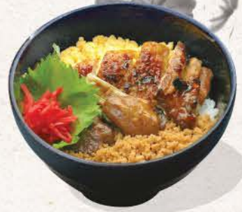
鶏照り焼き丼 Tori Teriyaki Don