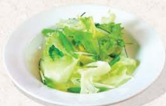
グリーンサラダ Green Salad