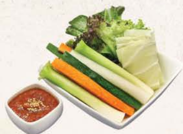
野菜丸かじり Yasai Maru Kajiri