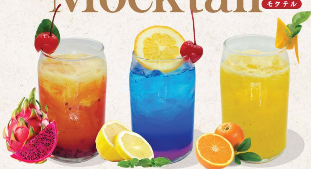
ドラゴンヘイズ Dragon Haze