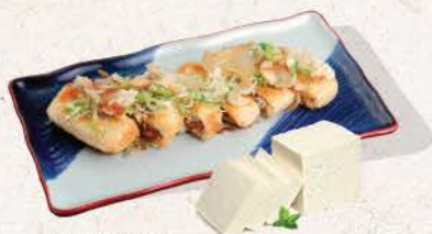
キツネ納豆 Kitsune Natto