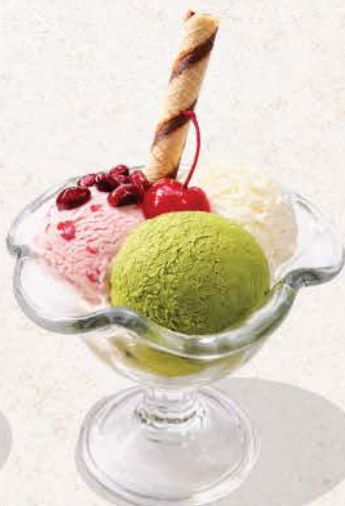
ミックスアイス クリーム Mix Ice Cream