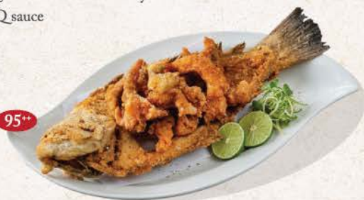
鱈フライ Aji Fry