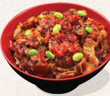
チョー元気丼 Cho Genki Don

original/super spicy pork belly saute with edamame on top of rice