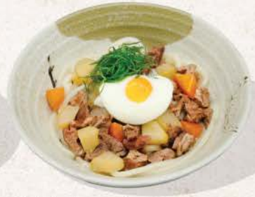
牛すじ煮込みうどん Gyūsuji Nikomi Udon

rich and creamy chicken broth ramen, with bacon, and various topping