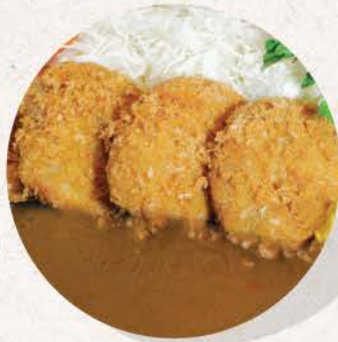
ヒレカツカレー Hire Katsu Curry

deep fried pork tenderloin cutlet with Japanese curry and rice