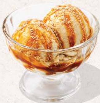
黒蜜きなこアイスクリーム Kuromitsu Kinako Ice Cream

vanilla based ice cream topped with kuromitsu ( Japanese brown sugar syrup ) and kinako ( roasted soybean powder )