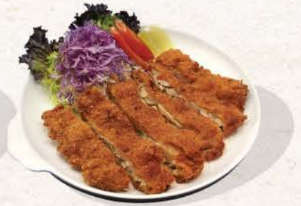
チキンカツ Chicken Katsu

90 ++ fried chicken cutlets with sweet teriyaki sauce