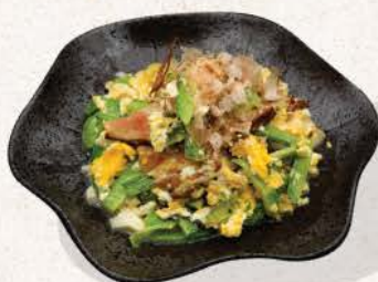
ゴーヤチャンプルーベーコン Gōya Champurū Bacon

Okinawan-style stir-fry of bitter melon with bacon, egg, and vegetables