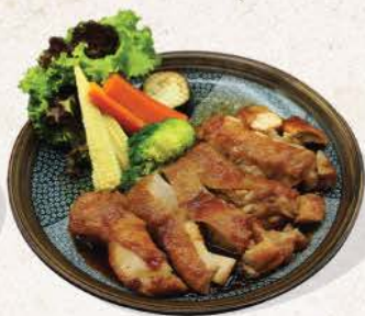
チキン照り焼き Chicken Teriyaki

fried chicken cutlets with sweet teriyaki sauce