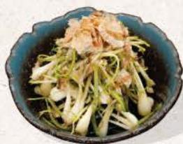
島らっきょう Shima Rakkyo