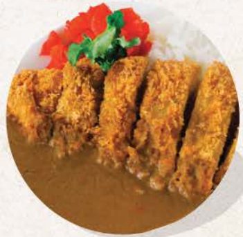
ロースカツカレー Rosu Katsu Curry

deep fried pork sirloin cutlet with Japanese curry and rice