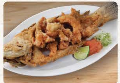
カレイから揚げ Karei Karage