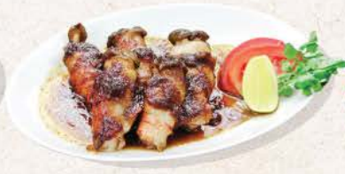
豚きのこ巻き Buta Kinoko Maki