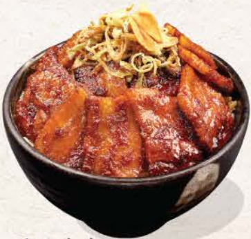
屯登本丼 Tontoki Don