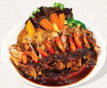
チキンハラペーニョ Chicken Jalapeno

grilled marinated chicken with spicy Jalapeno and teriyaki sauce