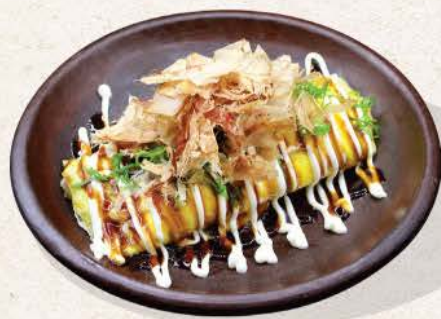
とん平焼き Tonpei Yaki