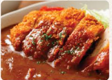
チキンカツカレー Chicken Katsu Curry

95 ++ fried rice wrapped in omelette with curry sauce