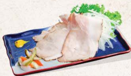
自家製ハム Jikasei Ham