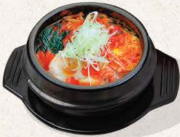
石焼地獄ラーメン Ishiyaki Jigoku Ramen

udon noodles with slow-simmered beef tendon