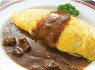
オムカレー Omu Curry

95 ++ fried rice wrapped in omelette with curry sauce