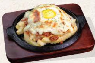
スパイシー ポテトオープン焼き Spicy Potato Oven Yaki