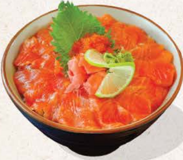
サーモン丼 Salmon Don