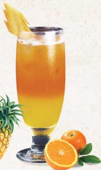
酒菜サンシャイン Sakana Sunshine