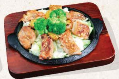
ガリバタチキン Garibata Chicken