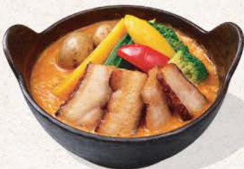
自家製ベーコンと野菜の スープカレー Jikasei Bacon to Yasai no Soup Curry

homemade bacon and vegetables soup curry