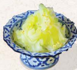
塩キャベツ Shio Kyabetsu