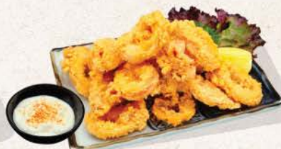
イカ唐揚げ Ika Karaage

crispy deep fried squid served with mayonnaise