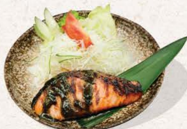
サーモン 海苔タレ Salmon Nori Tare

fresh salmon glazed with savory nori-based tare sauce