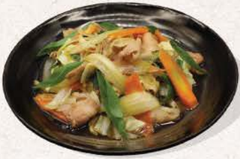
豚野菜炒め Buta Yasai Itame