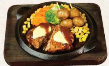
ポークハンバーグステーキ Pork Hamburg Steak

pork meatloaf patty steak & vegetables served in hot plate with 3 kinds sauce choice: demiglass / teriyaki / oroshi ponzu