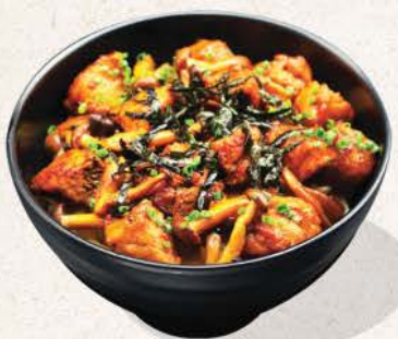
トンコロステーキ丼