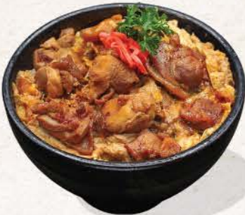
親子丼 Oyako Don

100 ++ crispy deep fried chicken cutlets and egg mixture on top of rice