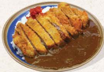
チキンカレー Chicken Curry