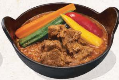
牛すじと野菜の スープカレー Gyusuji to Yasai no Soup Curry