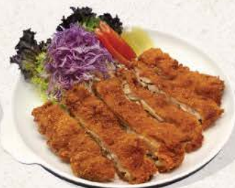
チキンカツ Chicken Katsu