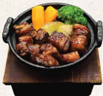
サイコロステーキ Saikoro Steak