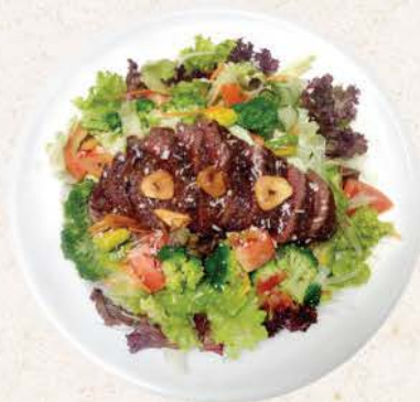
ビーフステーキプレミアムサラダ Beef Steak Premium Salad