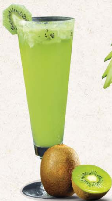
グリーンディライト Green Delight