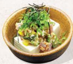
ネバネバ奴 Neba-Neba Yakko