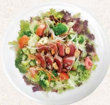
グリルツナプレミアムサラダ Grill Tuna Premium Salad