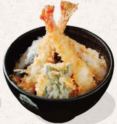
天丼 Ten Don