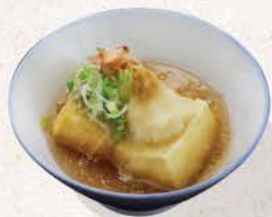
揚げ出し豆腐 Agedashi Tofu