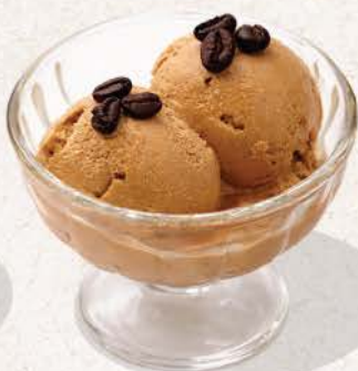
コーヒーアイス クリーム Coffee Ice Cream