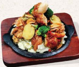
ガリバタチキンヒ〜ハ Garibata Chicken Hi-Ha

stir fried chicken with spicy garlic butter