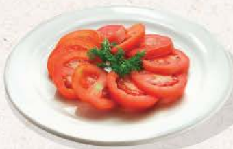
トマトサラダ Tomato Salad