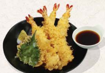
えび天ふら Ebi Tempura