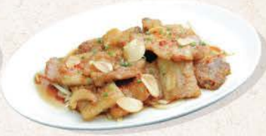
色登本焼き Tontoki Yaki