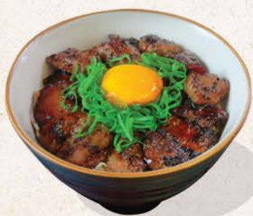
豚スタミナトリュフ丼