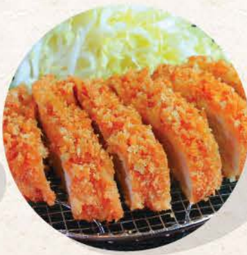
ロースカツ Rosu Katsu