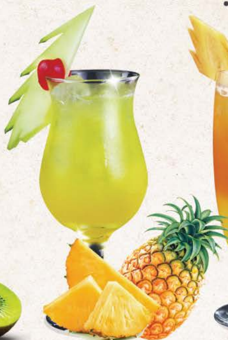
デロニックスパンチ Delonix Punch