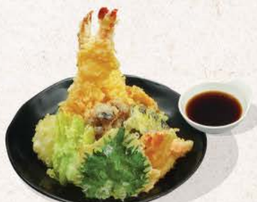
天ふら盛り Tempura Mori

assorted deep fried prawn and vegetables