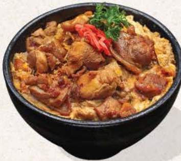
親子丼 Oyako Don