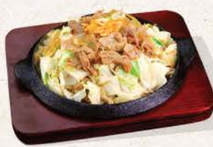
もつスタミナ焼き Motsu Stamina Yaki