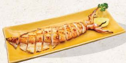
イカ姿焼き Ika Sugatayaki