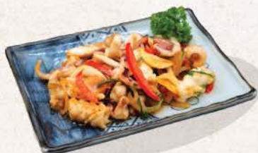
イカバター焼き Ika Butter Yaki