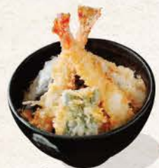
天丼 Ten Don tempura on top of rice