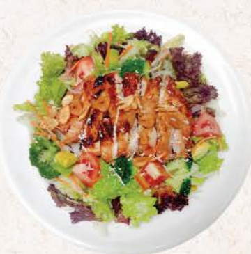
グリルチキンプレミアムサラダ Grill Chicken Premium Salad

vegetable salad with grilled chicken on top