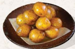
新じゃが蒸し Shinjaga Mushi