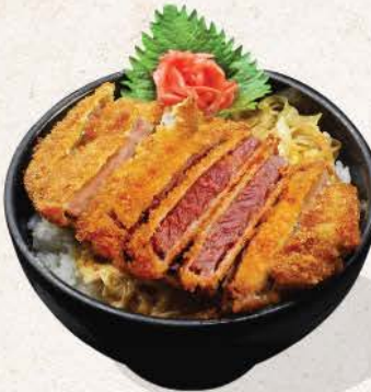
牛カツ丼 Gyu Katsu Don

crispy deep Australian beef cutlets and egg mixture on top of rice