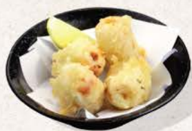
変わり竹輪天 Kawari Chikuwa Ten