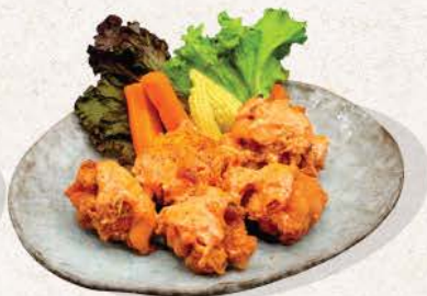
メンタイチキン唐揚げ Mentai Chicken Karaage