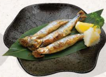
ししゃも焼き / 揚げ Shishamo Yaki / Age

lightly salted and savory grilled or deep-fried Japanese smelt