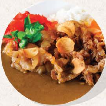
元氣カレー Genki Curry

sweet garlic sauced pork belly saute with Japanese curry and rice