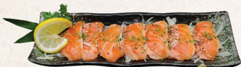
サーモンたたき Salmon Tataki

seared salmon slice marinated with orange & blackpepper sauce