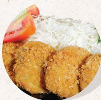
ヒレカツ Hire Katsu