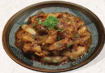
豚生姜焼き Buta Shoga Yaki