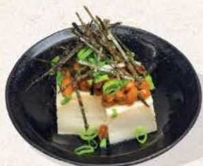
納豆奴 Natto Yakko