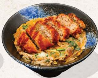
ポークハンバーグカツ丼