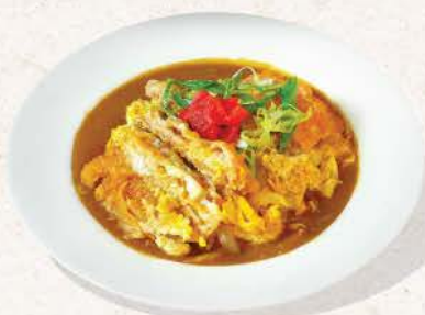
トンカツ丼カレー