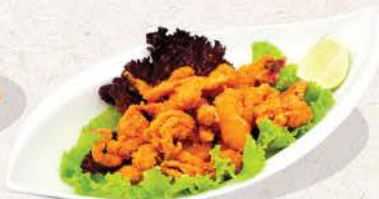
タコイカゲソ唐揚げ Tako Ikageso Karaage