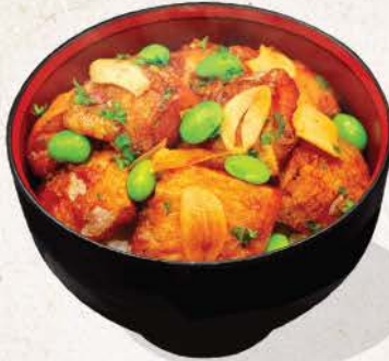
酒蒸丼 Sakana Don Original/Spicy

dice-cut teriyaki salmon belly on top of rice