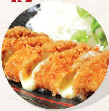
ミルカツチーズ Mirukatsu Cheese

deep fried pork sirloin cutlet with mozzarella cheese filling