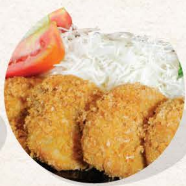
ヒレカツ Hire Katsu