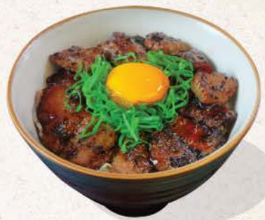
ビーフスタミナトリュフ丼 Beef Stamina Truffle Don

beef stamina rice bowl with truffle sauce