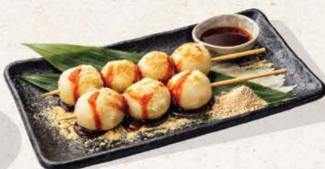
白玉だんご Shiratama Dango

soft and chewy rice dumplings served with kuromitsu ( Japanese brown sugar syrup )