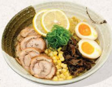
鶏白湯ラーメン Tori Paitan Rāmen