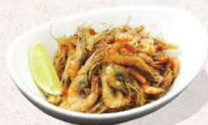
小エビから揚げ Koebi Karaage