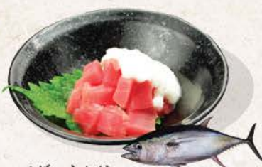
マグロ山かけ Maguro Yamakake