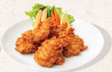
チキンから揚げ Chicken Karaage