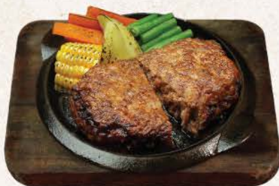
ビーフハンバーグステーキ Beef Hamburg Steak

beef meatloaf patty steak and vegetables served in hot plate with 3 kinds sauce choice: demiglass / teriyaki / oroshi ponzu