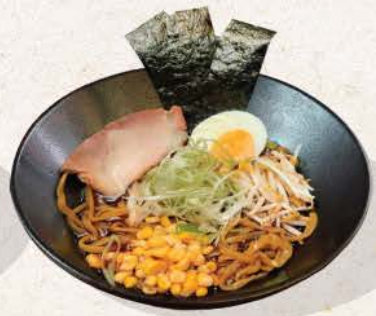
醤油ラーメンチキン・ポーク Shoyu Ramen Chicken/Pork