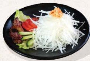
大根サラダ Daikon Salad