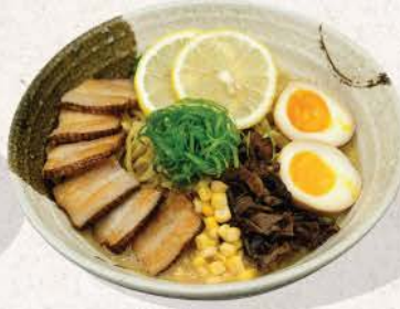
ベーコン白湯ラーメン Bacon Paitan Rāmen

rich and creamy chicken broth ramen, with chicken chashu, and various topping