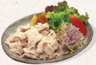
冷しゃぶ ポン酢・胡麻 Reishabu Ponzu / Goma

cold pork shabu-shabu with ponzu / sesame sauce