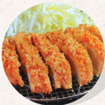
ローズカツ Rosu Katsu