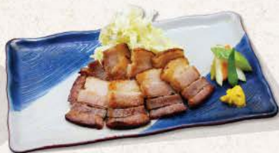
自家製ベーコン Jikasei Bacon