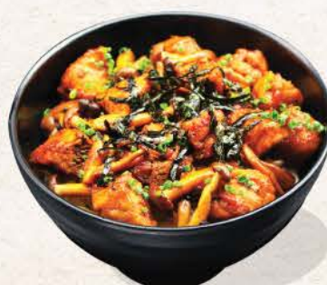
トンコロステーキ丼 Tonkoro Steak Don

sauteed dice-cut pork tenderloin with butter shoyu and shimeji mushroom on top of rice