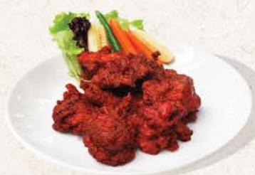
スパイシーチキン Spicy Chicken