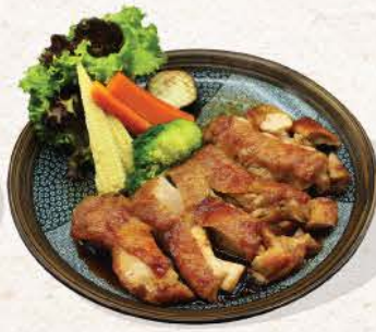
チキン照り焼き Chicken Teriyaki

100 ++ grilled marinated chicken with spicy Jalapeno and teriyaki sauce