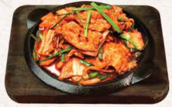
豚キムチ炒め Buta Kimchi Itame