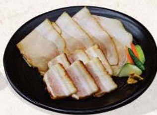
自家製ベーコンとハム Jikasei Bacon and Ham