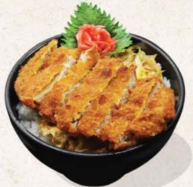
チキンカツ丼 Chicken Katsu Don

crispy deep fried chicken cutlets and egg mixture on top of rice