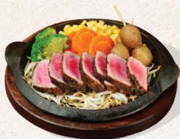
マグロ鉄板焼き (ブラックペッパー/BBQ)