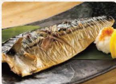
さば塩焼き Saba Shioyaki

140 ++ grilled salmon with teriyaki sauce / salt