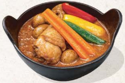
チキンと野菜の スープカレー Chicken to Yasai no Soup Curry