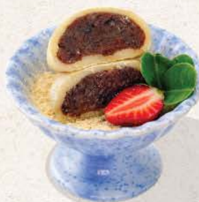
あずきもち Mochi Red Bean

Soft and chewy mochi filled with azuki ( sweet red bean paste )